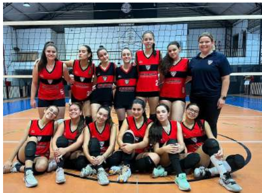
O Infantil II visitou o Ypiranga e foi derrotado por 3x0.