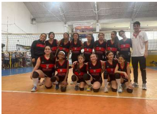
O Iniciantes perdeu do Ribeirão Pires por 3x0.