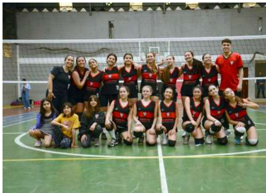
O Pré-Mirim bateu a equipe do Alpha-ville por 3x0.