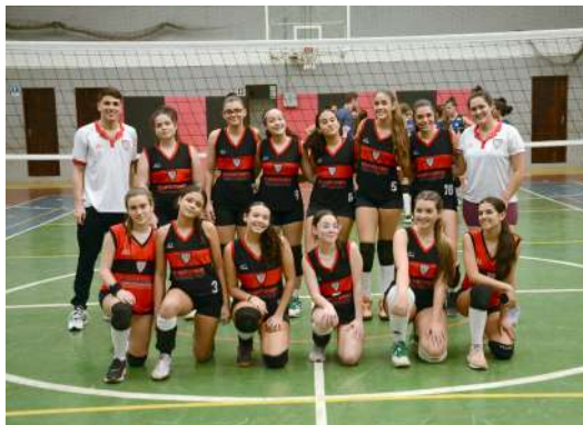
O Infantil I também teve a A.A.B.B como adversárias, mas acabaram sendo superadas por 3x0.