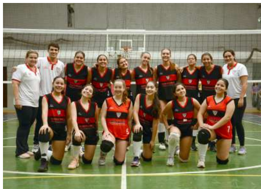
O Mirim conquistou para o CEP uma vitória importante, venceu a A.A.B.B por 3x2.