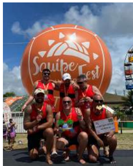
Categoria Masculino 1