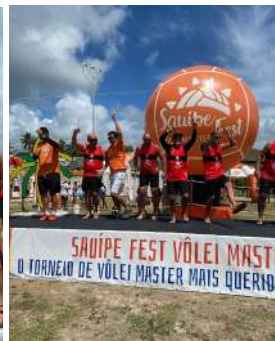
Categoria Masculino 2