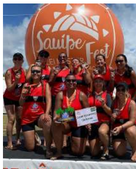
Feminino categoria 30+