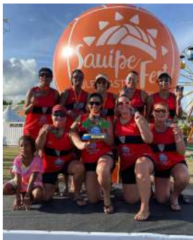
Feminino categoria 40+