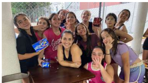
Vôlei de Base