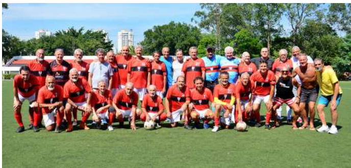
Futebol Master 65+

No dia 16 de dezembro, sábado, a categoria 65+ do CEP disputou a final do campeonato Interclubes de futebol. Em uma partida muito disputada contra a equipe do Banespa em nosso estádio, os times empataram em 1x1 no tempo normal. O título foi decidido nos pênaltis e terminou 5x4 para os visitantes. Parabéns a todos pelos trabalho e dedicação!